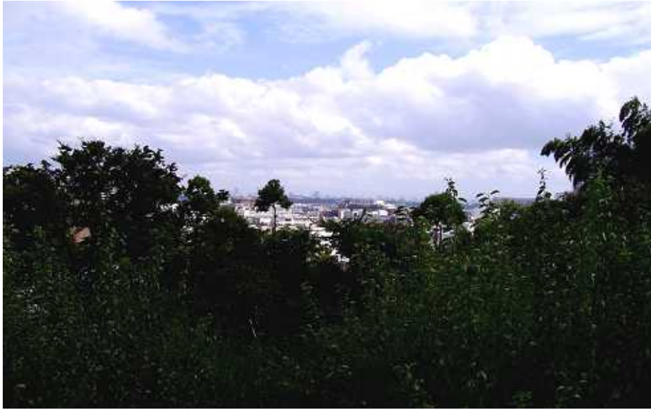
熊野森(久本山付近)より東京方面